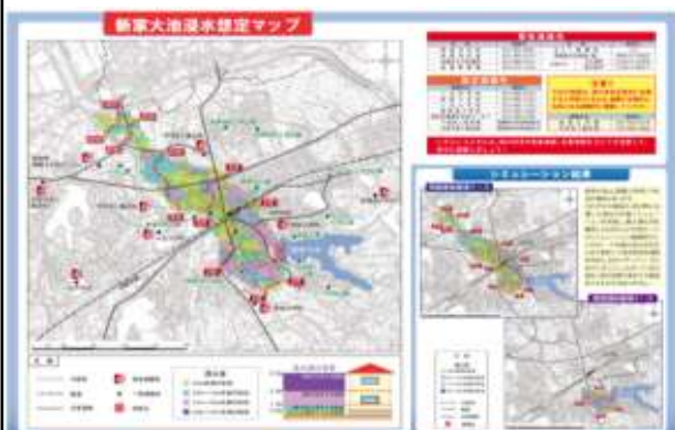
ハザードマップイメージ