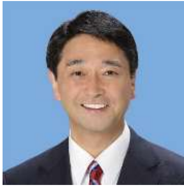
都道府県土地改良事業団体連合会会長会議顧問 参議院議員 進藤金日子