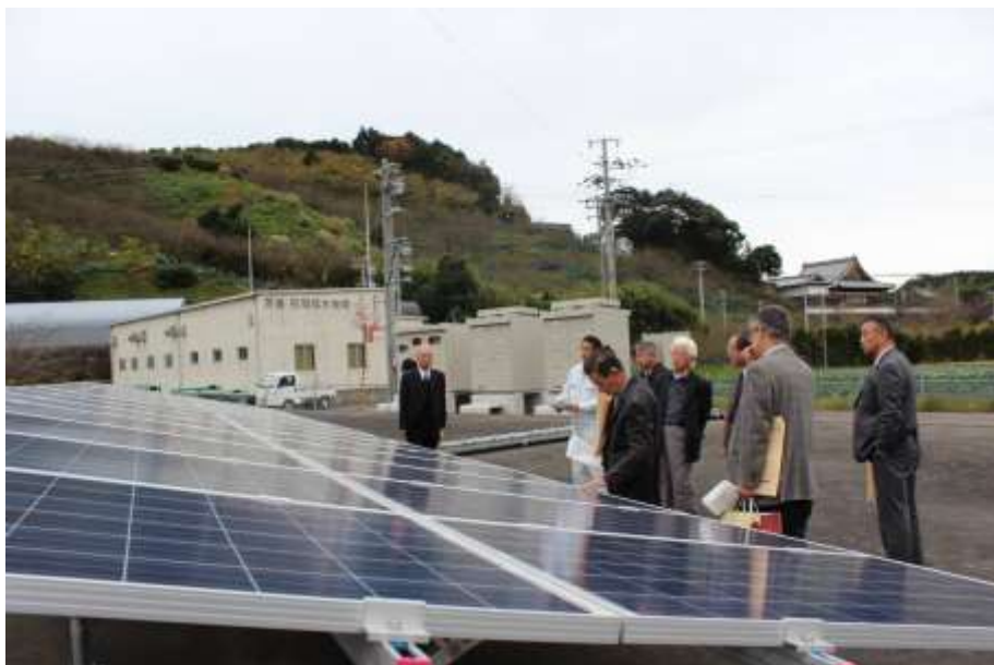
平成27.12.10 和歌山県南紀用水土地改良区