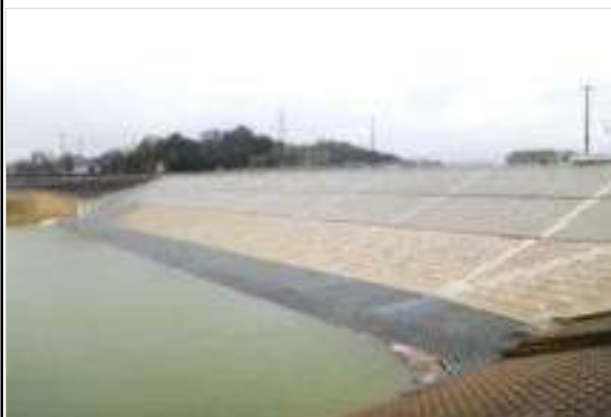
老朽ため池改修（大野池）