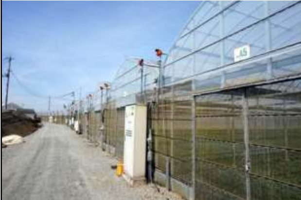
ほ場整備「長峯地区」(堺市)