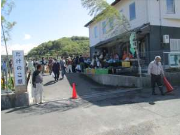
木積地区農空間保全協議会（貝塚市）H28. 4. 17