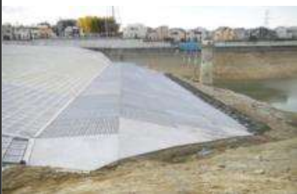
ため池の耐震対策（光明池）