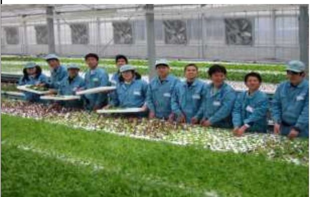
農用地総合整備事業「阿間河滝団地」 (岸和田市)