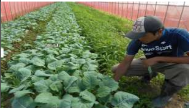
基盤整備促進事業「かるがもの里」 (泉南市)