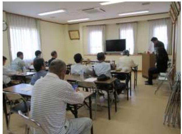
畑田寛農会（河南町）H28. 4. 23