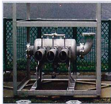
マイクロバブル発生装置

〒599-8254 住所：堺市中区伏尾155番地 電話：072-270-7767 携帯：090-3356-3573 FAX：072-270-9559